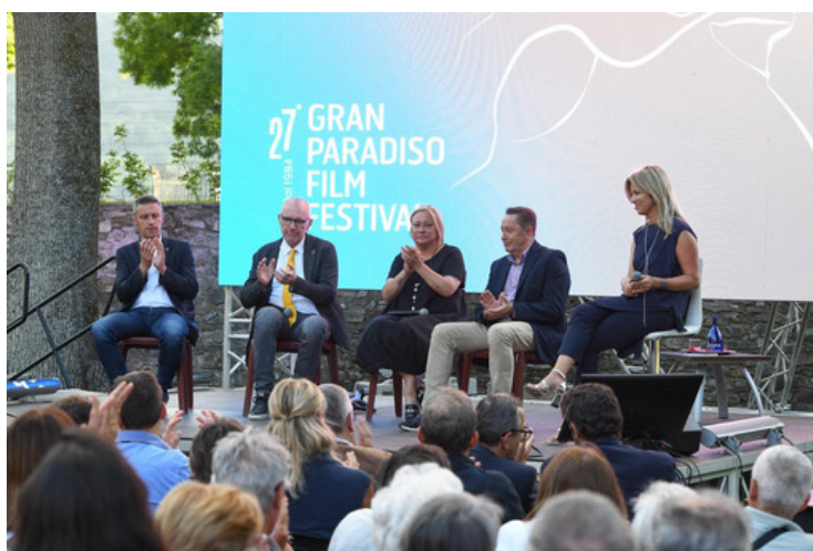
Tavola rotonda con le istituzioni coinvolte nella gestione dell'emergenza

Il castello di Aymavilles ha accolto l'inaugurazione della 27ma edizione del Gran Paradiso Film Festival, in collegamento con le sale di Cogne e Rhêmes-Notre-Dame